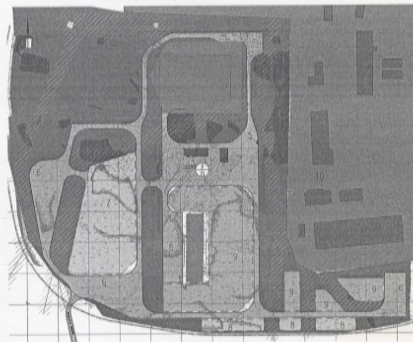
Схема планировочной организации земельного участка М 1:2000

ПРИЛОЖЕНИЕ к постановлению Администрации Златоустовского городского округа от 29.05.2014 г. № 225-П